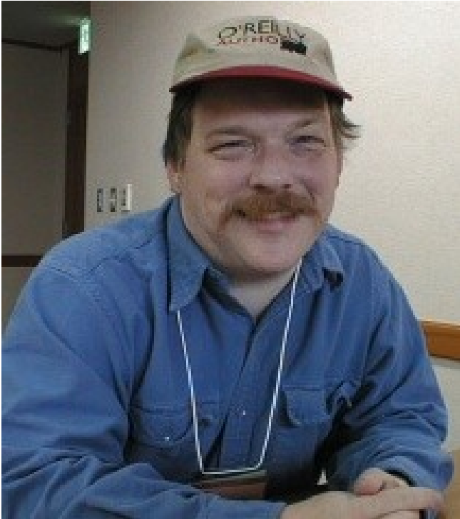
Eric S. Raymond